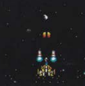
レベル1 まえ ほうこう 前2方向