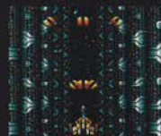
レベル2 まえ ほうこう 前3方向