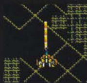
レベル1 まえ ほん 前1本

3つのショットの中で一番強力なパワーを持っているが、レベルが上がっても攻撃範囲が狭い。固い敵、ボスキャラなどには特に有効だ。