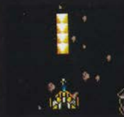
レベル3 ふと ほん 太1本