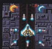
レベル3 ぜん ごかく ほうこう さゆう 前後各2方向+左右