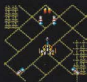
レベル2 ぜん ごかく ほうこう 前後各2方向