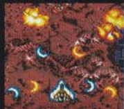
レベル3 まえ ほうこう 前4方向ワイド