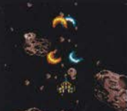
レベル1 まえ ほうこう 前2方向

パワーと攻撃範囲のバランスが一番良く、使い易い。ただし、画面を覆いつくすほど大量に発射されるレーザーで、敵の発射する弾が見えにくくなるのがデメリット。