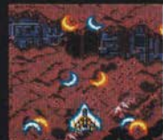
レベル2 まえ ほうこう 前4方向