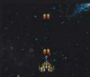
レベル1 まえ ほうこう 前1方向

ヴェリテックスが最初から装備しているショット。レベル3になると広範囲に攻撃できるのがメリットだが、今いちパワー不足。