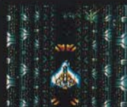
レベル3 まえ ほうこう しろ ほうこう 前3方向+後2方向