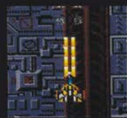
レベル2 まえ ほん 前2本